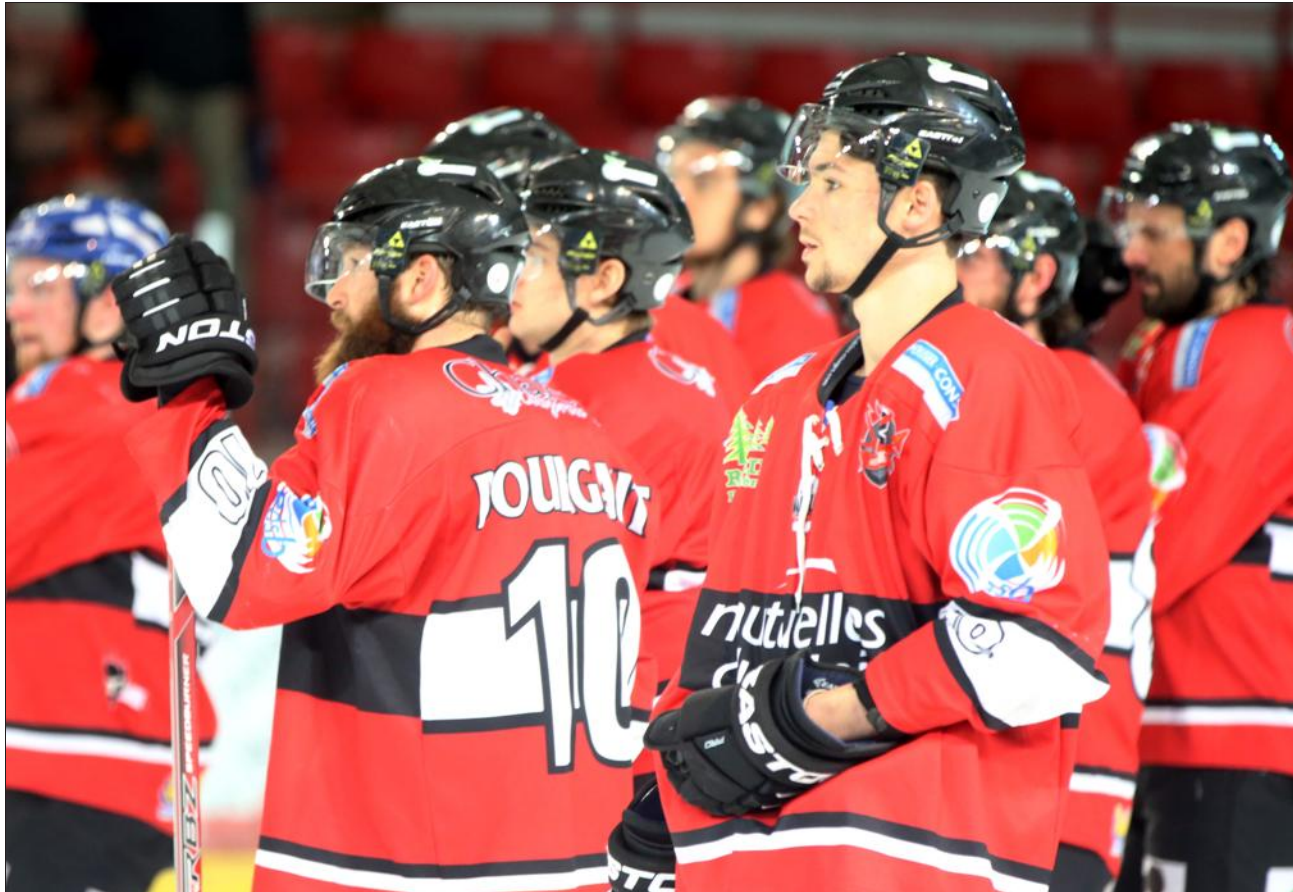
Les Diables rouges, deux ans seulement après avoir connu le meilleur avec le titre de champion de France, ont connu cette saison le pire. Ils évolueront en Division 1 la saison prochaine.